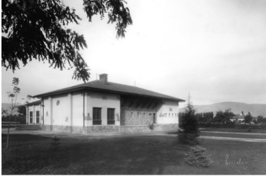
GAZİNO VE SİNEMA BİNASI