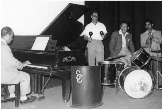
ŞEKERSPOR KÜLÜBÜ CAZ ORKESTRASI

“1972 de Emekliler Cemiyeti'nin bulunduğu yerde bir havuz vardı, havuzun yanında bir sahne bulunmaktaydı. Bu sahnede mikrofon ve ses sistemi bulunmaktaydı. Kendini göstermek isteyen amatör şarkıcılar buraya çıkar, hem enstrümanlarını çalar hem de şarkı söylerlerdi. Kim isterse çıkabiliyordu. Ben o dönemlerde tiyatro ile ilgileniyordum. Fabrikanın sinema salonunda (Foto-7) haftada bir kez gösterimiz oluyordu. Hatta farklı il ve ilçelere de gidip gösterilerde bulunurduk.”()