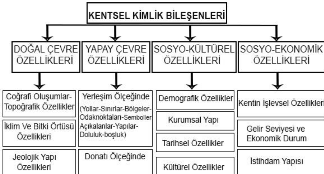
Şekil 1. Kentsel kimliği oluşturan bileşenler (Lynch, 1960; Ocakçı, 1994; Kılınçarslan, 1995; Ünügür, 1996’dan akt. Topçu, 2011)

Kentin insanlar tarafından nasıl algılandığı, o kenti diğer kentlerden ayıran, kendine özgü özelliklerinin neler olduğu sorularının cevapları kent kimliği kavramını ortaya çıkarmıştır. Kentin ilk yerleşik yapıya geçilmesinden günümüze kadar geçirdiği evreler; sosyal, ekonomik, fiziksel vs. olaylar kimliği ortaya çıkarmaktadır.