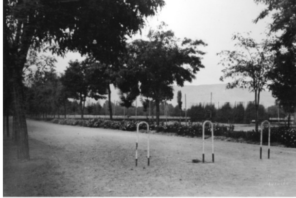
Foto 6. Tenis Kortu

“Günümüzde daha çok kafelerde görüşüyoruz. Özellikle iş yerinden arkadaşlarla toplantılarımızı Şelale Restoran, Eylül Restoran gibi mekânlarda yapıp, sohbet muhabbet ediyoruz.”(4)