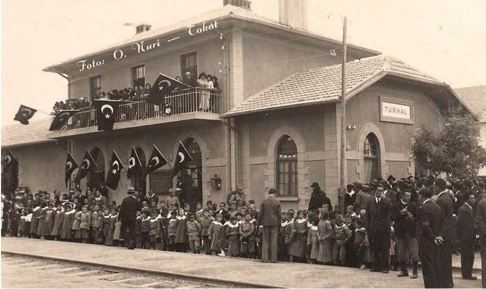
Foto 1. Turhal Tren İstasyonu