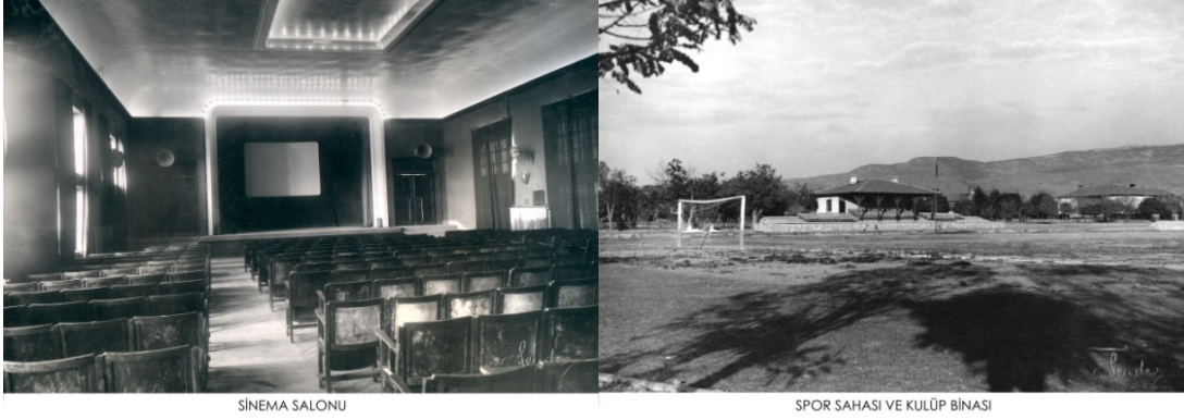
Foto 7. Turhal Şeker Fabrikası Sineması Foto 8. Şeker Spor Kulübü ve Stadyum

Turhal’da eskiden milli ve dini bayramlarda yapılan kutlamalara ilişkin görüşler: