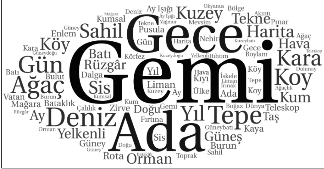
Şekil 2. Define Adası Eserindeki Coğrafi Kavramların Kelime Yoğunluk Haritası

çok yer alan ulaşım coğrafyası kavramları; gemi , yelkenli ve tekne kavramlarıdır. Buna karşın, hikâye kitabında en az ise rota , rihtım ve iskele kavramları yer almaktadır.