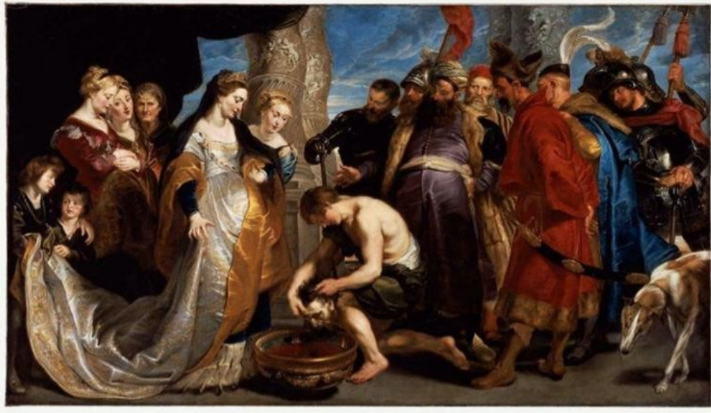
Örnek-7. 'Head of Cyrus Brought to Queen Tomiris'

(Cyrus'un Kellesi Kraliçe Tomrise Getirildi), Boston Güzel Sanatlar Müzesi, Amerika