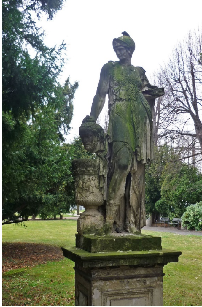
Örnek-12. 'Tomırs ve Cyrus', Dresden'de bir Hastane bahçesi, Almanya

Wiskotchill, 12. Örnek'te görülen ve Almanya Dresden'de bir hastane bahçesine yaptıđı eserinde, Tomris Hatun'u Cyrus'un bedeninden ayrılmıř bařını tutarken betimlemiřtir. Hemen yanında kabartmalı iřlemeleri olan bir havza bulunmaktadır. Bu kabartmalar, mücadele eden insanların tasvirinden oluřmaktadır. Tomris Hatun, savařçı kiřiliđiyle betimlenmiřtir. Bařındaki, diagonal Őekiller ve çiçeklerle iřlemeli kaskı Tomris'in kadın savařçı kimliđine vurgu yapıldıđını dūřündürmektedir.