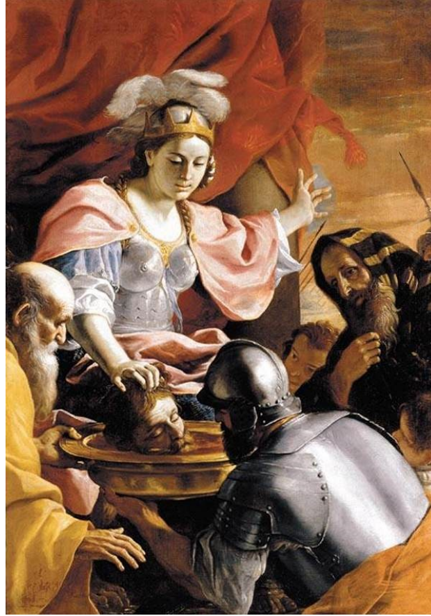
Örnek-5. 'Tomiris ve Cyrus'

Pretti'nin, 24 Şubat 1613 yılında İtalya'da doğduğu ve bir Barok Dönemi sanatçısı olduğu bilinmektedir. Sanatçı, dini ve mitolojik figürleri eserlerine konu edinmiş, daha çok kilise duvarlarına resimler yapmıştır. Çalışmalarına uzun yıllar devam eden sanatçı, birçok eser bırakarak 1699 yılında ölmüştür.