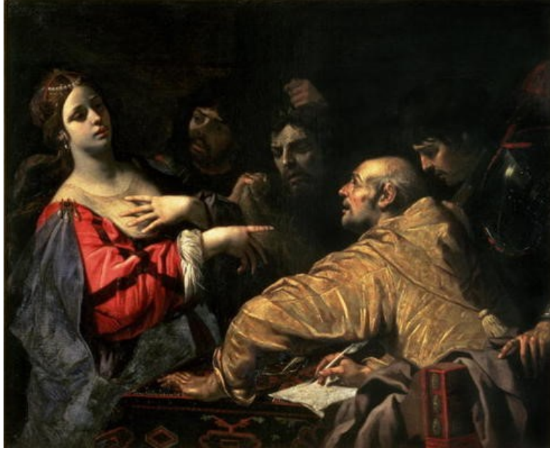
Örnek-4. "Queen Tomyris with the head of Cyrus the Great" (Kraliçe Tomris ile Pers lideri Cyrus), 17. yy, Bavarian Devlet Resim Galerisi, Almanya.

4. Örnek'te görülen "Queen Tomyris with the head of Cyrus the Great" (Kraliçe Tomris ile Pers lideri Cyrus) adlı eser, 150 Cm x 200 cm boyutlarında tuval üzeri yağlı boya tekniği ile resmedilmiştir. 17.yy.a ait eser, Almanya Bavarian Devlet Resim Galerisi'nde sergilenmektedir.