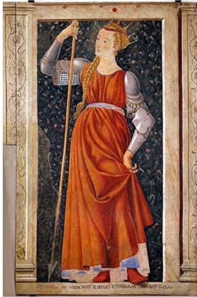
Örnek-2. “ Queen Tomyris ”, 1448, Uffizi Galerisi, Floransa

2.Örnek’te görülen “ Queen Tomyris ” adlı eserin, Fresk tekniği kullanılarak resmedildiği bilinmektedir. Fresk (Fresco), yaş sıvı üzerinde suda çözülmüş boya ve pigmentleri kullanılarak yapılan duvar resmi tekniğidir (Tanyeli ve Sözen 1986, s.86). Fresk resmi, sanat tarihinin en eski yöntemlerinden biridir. Kimi zaman bir mağaranın duvarında kimi zaman bir kilise yada sarayda duvarları süslemiştir. Castagno, Queen Tomyris (Kraliçe Tomris) adlı çalışmasını fresk tekniği kullanarak San Pier kilisesinin duvarına uygulamış fakat bu fresk uzun yıllar sonra duvardan kaldırılıp tahta üzerine aktarılarak Floransa’da bulunan Uffizi galerisinde sergilenmiştir.