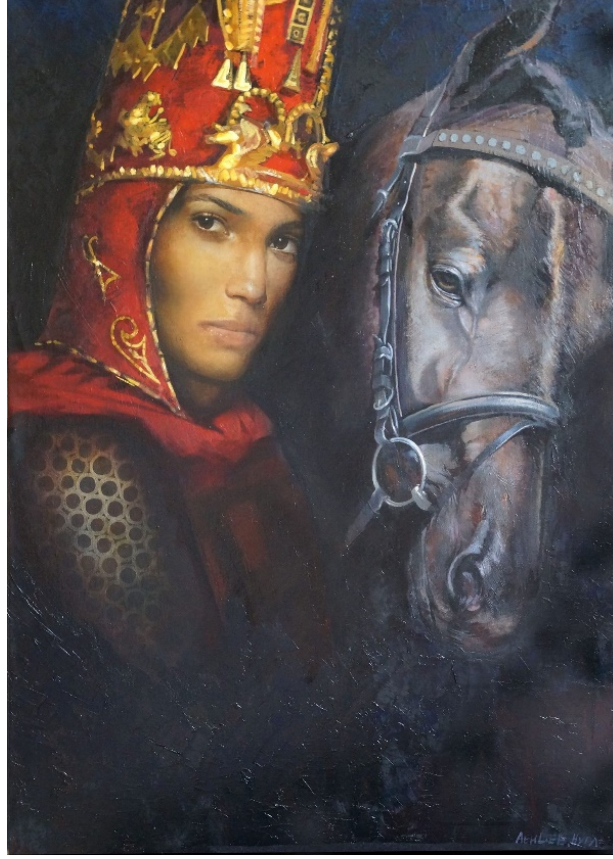
Örnek-6. 'The queen of Skythian tribe Massagetean'

6.Örnek'te görülen eser, 80 cm x 140 cm boyutlarında, tuval üzerine yağlı boya tekniği ile çalışılmıştır. Dikey düzlem üzerine resmedilen çalışmada Tomris Hatun, kırmızı başlığı ile dikkat çekmektedir. Başlık, altın renginde işlemlerle süslüdür. Koyu zemin üzerine resmedilen Tomris'in kıyafeti, ilgiyi üzerine toplamaktadır. Resimde Tomris, yanında kahverengi atıyla birlikte işlenmiştir. Eser, portre çalışması olarak değerlendirilebilir. Atın ve Tomris'in duruşu yüz ifadesiz olarak betimlenmiştir. Kraliçe Tomris, yalnızca gösterişli başlığı ile vurgulanmıştır. Atı ile olan samimiyeti, Tomris'in Türk kadın hükümdarı olmasıyla ilişkilendirilmektedir. Zira "Atsız kahraman, kahraman değildir. Yalnızca ata binen insan kahraman, alp olarak nitelendirilmektedir" (Surazakov, 1985: 26).