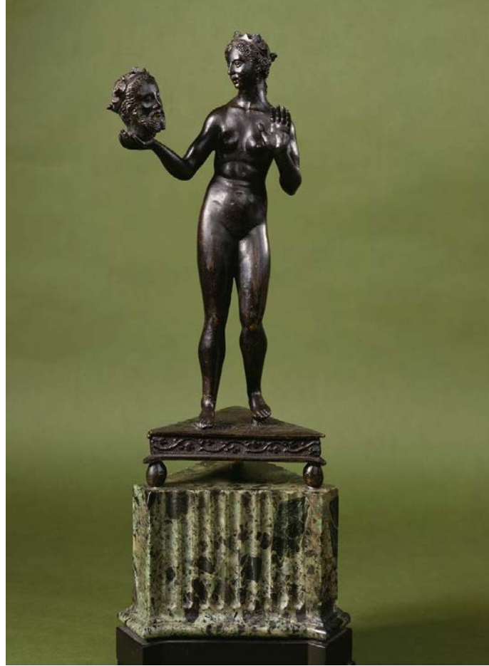
Örnek-11. 'Queen Tomyris with the head of Cyrus' (Kraliçe Tomris ile Cyrus), 1500, New York