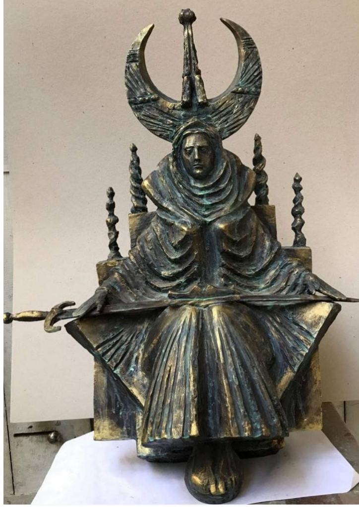
Örnek-10. 'Tomris Ana'

Ahmedov, 10. Örnek'te görülen çalışmasını, polyester döküm 60 x 70 x 40 boyutlarında yapmıştır. Tomris Hatun, tahtında oturur vaziyette betimlenmiştir. Heybetli bir duruş görülmektedir. Başlığında bulunan büyük hilal yapısı dikkat çekmektedir. Ahmedov'un bu eserinde, Tomris Hatun'un hükümdar yahut savaşçı özelliklerine sembolik bir vurgu yapmadığı görülmektedir. Tomris'in dizleri üzerine yatay formda işlenen uzun kılıcı, baş kesen yahut savaşan bir kılıç olarak dikey formda işlenmemiş; aksine koruyuculuğu, özgürlüğü ve kahramanlığı temsil etmesi düşüncesiyle yatay formda gerçekleştirilmiştir. Bu eserde, Tomris Hatun'un resimlerdeki betimlemelerden farklı bir kimlikle, yalnızca "Tomris, Ana ve Koruyucu Kahraman" kimlikleriyle görülmektedir. Tomris'in elleri kılıcının üzerinde betimlenmiştir ve bu detay Tomris'in koruyucu özelliğine vurgu yapmaktadır. Kahraman duruşu ise vatanını koruyan, özgürlüğüne önem veren ve barışı isteyen Tomris özelliklerinin bütünü olarak değerlendirilmiştir.