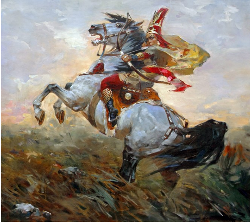
Örnek-8. 'Kraliçe Tomris', Kazakistan

12 Haziran 1973 yılında Kazakistan'ın Almatı şehrinde doğan ve realist düşünceler üzerine eserler üreten bir ressam olduğu bilinmektedir. 1992 yılında Almatı Sanat Koleji Resim Bölümünden mezun olmuştur. Daha sonra Kazakistan Devlet Sanat Akademisi'ni bitiren sanatçı, özellikle millî değerler üzerine icra ettiği eserleriyle bilinmektedir. 2009 yılından beri Kazakistan Sanatçılar Birliği üyesidir.