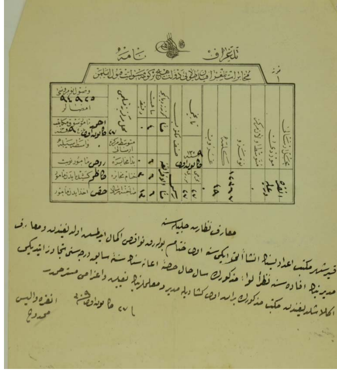
Ek-1: İnşaati tamamlanan Kırşehir Mekteb-i İdâdîsî'nin açılarak müdür ve muallimlerinin gönderilmesinin Ankara Valiliği'nden talep edildiğine dair belge.