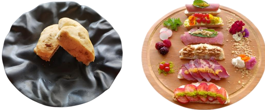
Fotoğraf 2. Cevizli lokum ekmeğinin geleneksel ve modern sunumları

Cevizli lokum ekmeği, modern sunum yaklaşımlarıyla ele alınarak füzyon mutfak ve moleküler gastronomi teknikleri ışığında yeniden yorumlanmıştır (Fotoğraf 2). Ürünün hazırlık aşamasında yöresel reçeteye sadık kalınmış ancak sunum aşamasında İtalyan mutfağına özgü Bruschetta tarzı kesim ve düzenleme teknikleri uygulanarak geleneksel form modernize edilmiştir. Buna ek olarak hem tadını hem de görsel açıdan zenginleştirmek için moleküler gastronomiden küreleme tekniği kullanılmıştır. Cevizli lokum ekmeğinin modern sunumunda kullanılan füme et ve pastırma gibi ürünleri tat açısından zenginleştirmek için asidite (ekşilik) veya ferahlık kazandıracak nar suyu ve fesleğen/nane (bitki özü) havyarı hazırlanmıştır.