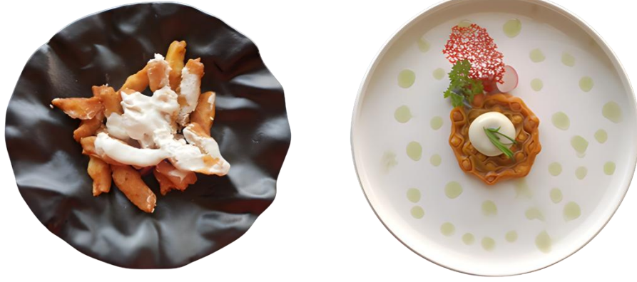
Fotoğraf 3. Nohutlu tepsi mantısının geleneksel ve modern sunumları