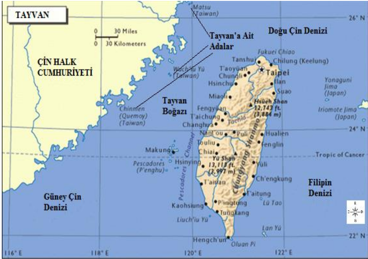
Şekil 9: Çin Halk Cumhuriyeti- Tayvan (Çin Cumhuriyeti)

kalmıştır. Bu dönemde Çin’de iktidarda olan Milliyetçi Parti, 1949’da gerçekleşen devrim ile iktidarı Komünist Parti’ye devretmek zorunda kalmıştır (Alagöz, 2019).