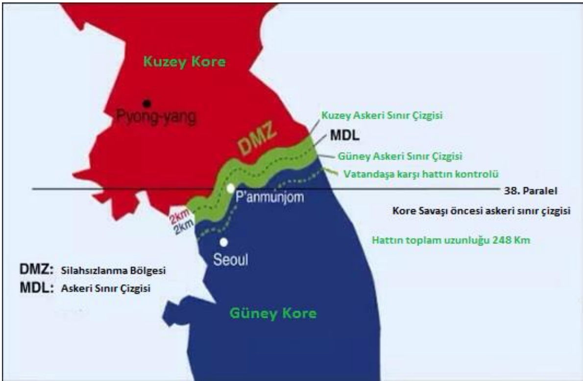
Şekil 4: Günümüzde Güney Kore- Kuzey Kore Sınırı

"gönüllüler" den oluşan ordularını 26 Kasım'da karşı saldırıya geçirmesi paniğe neden oldu. Çin kuvvetlerinin kuşatma harekâtını önleme görevi aynı gün bölgeye ulaşan Türk Tugayı'na verildi. BM Ordusu, 30 Kasım'dan itibaren önce Pyongyang sonra da Seul'e geriledi. 31 Aralık'taki büyük saldırı, BM Ordusunun durumunu sarstı. Seul boşaltıldı. Çin hücumu devam ederken, BM'nin Kore anlaşmazlığını çözüme girişimleri Sovyetler ve Çin tarafından yetersiz bulundu. Kaesong'da 10 Temmuz 1951'de başlayan ateşkes görüşmeleri, 27 Temmuz 1953'te Panmunjom'da sonuçlandı (Yaman, 2005, s. 232-233).