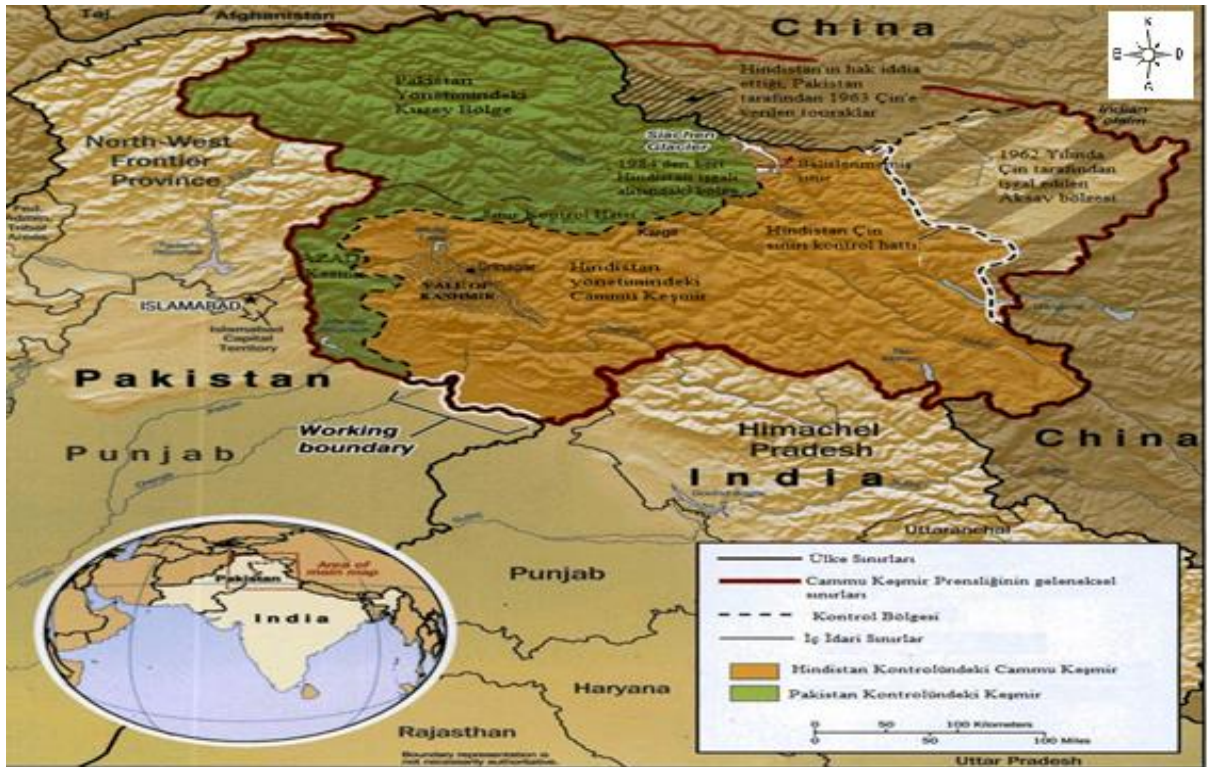
Şekil 2: Pakistan – Hindistan sınırı (URL 2'den erişilmiş ve düzenlenmiştir)

Hindistan 3,287,263 kilometrekare alana sahiptir. Bangladeş ile 4142 km, Butan ile 659 km, Burma ile 1468 km, Çin ile 2659 km, Nepal ile 1770 km, Pakistan ile 3190 sınır komşuluğu bulunmaktadır. Hindistan ayrıca 7.000 km'lik kıyı şeridine sahiptir. Ülke 1.296.834.042 (2018) nüfusu ile dünyanın en kalabalık 2. ülkesidir. Ülke nüfusunun %79,8'i Hindu, %14,2'si Müslümandır. Ülkenin GSYİH 2,602 trilyon dolardır. Askeri harcamalar, gayri safi yurtiçi hasıla yüzdesi %2,42'dir. Bu oranla dünyada askeri harcamalar sıralamasında 35. sıradadır (CIA, 2019).