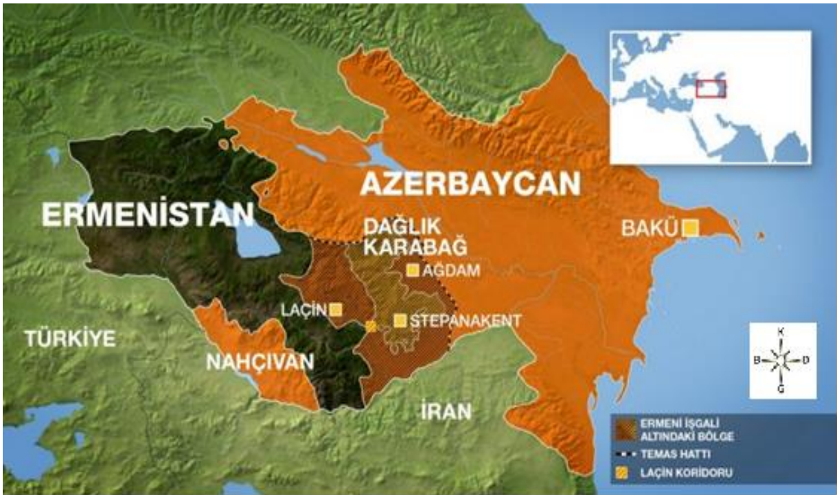
Şekil 6: Azerbaycan – Ermenistan Sınırı (URL 6'dan alınmıştır).

SSCB'nin çöküşü ve Soğuk Savaşın sona ermesi ile birlikte Kafkasya bölgesi başta olmak üzere dünyanın birçok kısmında iç ve etnik çatışmalara tanık olunmuştur. Karabağ, Güney Kafkasya'da dağlık bir bölgedir. Dağlık Karabağ bölgesi, yaklaşık 4.400 km 2 'lik büyük bir araziye kapsamaktadır (Huseynov, 2010, s. 15). Dağlık Karabağ çoğunlukla ormanlık bir bölgedir. Soğuk Savaş sonrasında Kafkasya bölgesinin doğal, coğrafi, ekonomik ve jeopolitik durumu ve verimli, zengin ekonomik ve kültürel iş birliği potansiyeli bölgeye stratejik boyut kazandırmıştır (Ghavam, 2011).