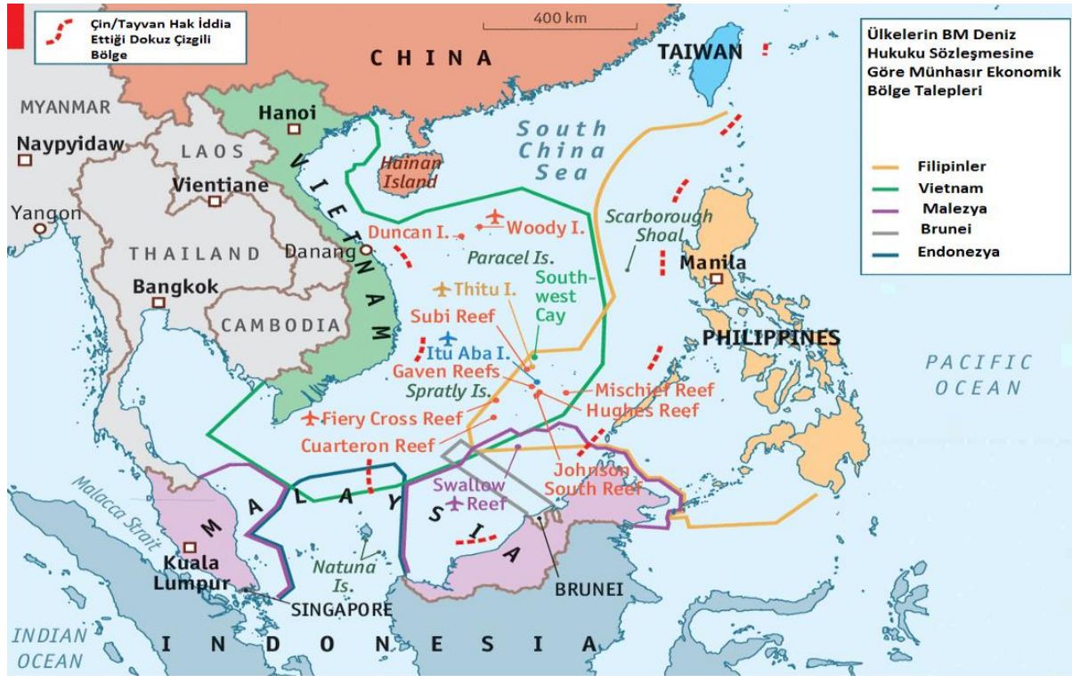
Şekil 7: Güney Çin Denizi

Güney Çin Denizi sorunu, Güney ve Uzak Doğu Asya'nın bulunduğu coğrafyanın en önemli sorunlarından birisidir. Bu sorun yakın gelecekte dünya gündeminde daha fazla yer tutacaktır. Güney Çin Denizi, adından anlaşılacağı üzere Çin'in güneyinde, Vietnam, Malezya ve Sumatra'nın doğusunda, Filipinler'in batısında, Bangka Belitung Adaları ve Borneo'nun kuzeyinde bulunan bir denizdir. Bu bölge sahip olduğu yer altı zenginliklerinin yanı sıra önemli ticaret yollarının geçtiği boğazlara sahip olması nedeniyle yakın zamanda çatışma ve savaşlara neden olabilecek bir potansiyele sahiptir. Çin Halk Cumhuriyeti başta olmak üzere, Vietnam, Filipinler, Malezya, Endonezya, Tayvan ve Brunei arasında dönem dönem gerginlik ve çatışmalara neden olmuştur. ABD, Avustralya, Japonya gibi bu denize kıyısı olmayan devletlerin siyasi ve ekonomik menfaatlerini doğrudan etkilediği için Güney Çin Denizi aynı zamanda uluslararası bir sorundur.