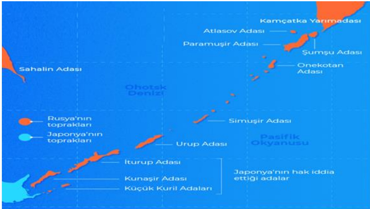
Şekil 8: Rusya-Japonya ihtilafli sınırları

Rusya ile Japonya'nın arasında bulunan Kuril Adalarının hangi ülkeye ait olduğu tartışmaları uzun yıllardır devam etmektedir. Pasifik Okyanusu'nda bulunan Kuril Adaları Iturup, Kunaşir, Şikotan ve Habomai adalarından oluşmaktadır.