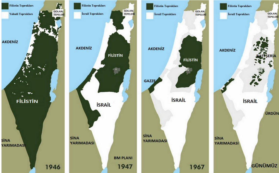
Şekil 5: Geçmişten günümüze Filistin-İsrail Sınırı (URL 5'den adresinden erişilmiş ve düzenlenmiştir)

Araplar hayır dediler. Bu sırada yapılan savaş sırasında Filistinliler mülteci olarak bu toprakları terk ederken onların boşalttığı yerlere Yahudi mülteciler yerleştiler. Bu sırada Mısır, Filistin toprağı olan Gazze'yi, Ürdün ise Doğu Kudüs'ü alacak şekilde Batı Şeria bölgesini işgal etti. 1967 yılında yapılan Altı Gün Savaşı sırasında İsrail devleti Kudüs'ün, Batı Şeria ve Gazze'nin kontrolünü ele geçirdiler. 2005 yılında İsrail Gazze'den çekilmesine karşın Batı Şeria'da Yahudi yerleşimciler varlığını devam ettirmektedirler.