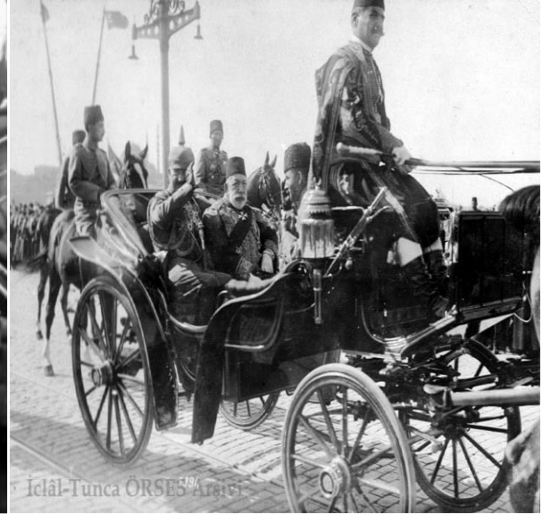
Fotoğraf 6: Sirkeci garından Şale Köşküne gidilirken aynı arabada bulunan Kayzer 2. Wilhelm, Sultan Mehmed Reşad ve Enver Paşa. https://canakkalemuharebeleri1915.com/makale-ler/151-iclal-tunca-orses/386-son-kez-deutschland-uber-alles-kayzer-2-wilhelm-in-turkiye-ye-son-ziyareti