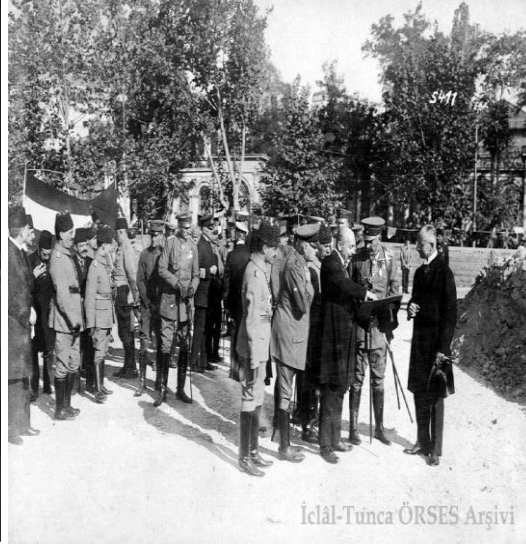
Fotoğraf 7: II. Wilhelm Tarabya'da mezara çiçek bırakırken. (Kirel ve Ortaklan, 2018:139).